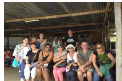
L'équipe de l'HAD Cayenne et d'ALIVE

Nous avons vraiment apprécié cet accueil chaleureux qui s'est poursuivi le week-end par une prise en charge par l'équipe HAD pour nous faire découvrir les plus beaux endroits de la Guyane.