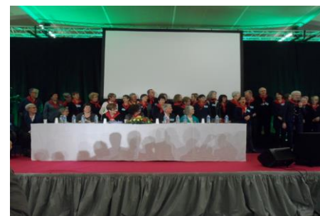
Les membres du CA de la Fédération et les bénévoles de JALMALV ORLÉANS