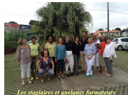
Les stagiaires et quelques formateurs

Nous prenons alors un temps avec l'équipe d'ALIVE pour un debriefing sur cette semaine de formation.